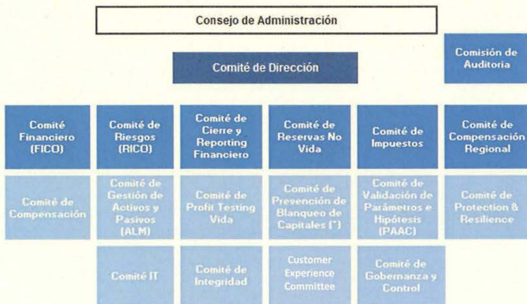
Gráfico 1. Estructura de gobierno de Allianz Seguros

El Comité de Dirección delega en comités parte de sus funciones. La estructura de gobierno de la Sociedad es la siguiente: